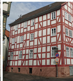
Beispielhaft: Lindenstr. 37 nachher