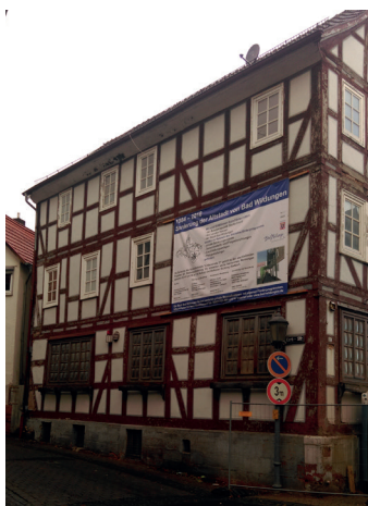
Beispielhaft: Lindenstr. 37 vorher

Lassen Sie sich kostenlos von uns beraten!